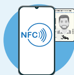
NFC en celular