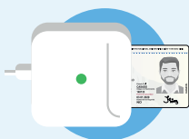
Lector para computadora